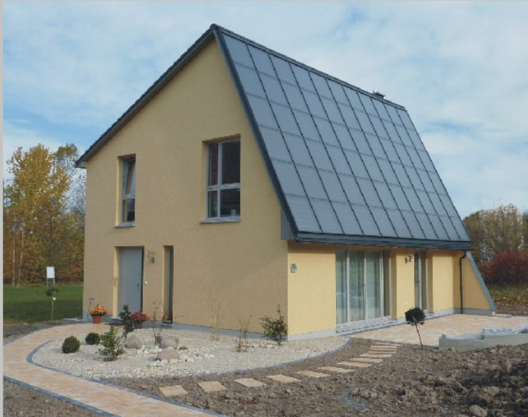
Erste Außenanlage beim ehemalige Muster-ENERGETIKhaus100 auf den Angerflächen..