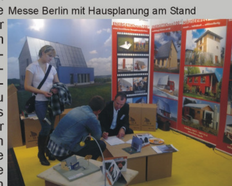
Messe Berlin mit Hausplanung am Stand