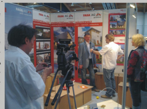
Messe Sinsheim mit Pressealarm