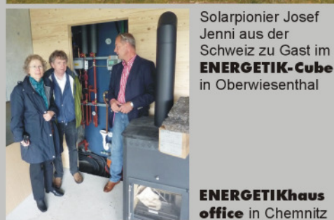
Solarpionier Josef Jenni aus der Schweiz zu Gast im ENERGETIK-Cube in Oberwiesenthal