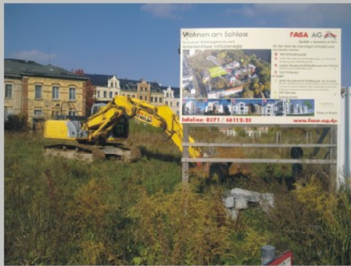
Erste Baugeräte sind schon da ...

duellen Gestaltungsmöglichkeiten des noch vakanten Stadthauses stehen Ihnen die Ansprechpartner der FASA zusammen mit dem zuständigen Architekturbüro gern beratend zur Seite. Informationen und individuelle Vorort-Termine erhalten Sie von Herrn Krauß (Tel.: 0371/46112-20, Mail: krauss@fasa-ag.de) oder Herrn Vogel (Tel.: 0371/46112-17, Mail: vogel@fasa-ag.de). Das nächste Informationswochenende findet am 13. + 14. November d.J., jeweils von 13 bis 16 Uhr, auf dem Areal der ehemaligen Schloßbrauerei (Abteiweg, ehem. Inselstr. ) statt.