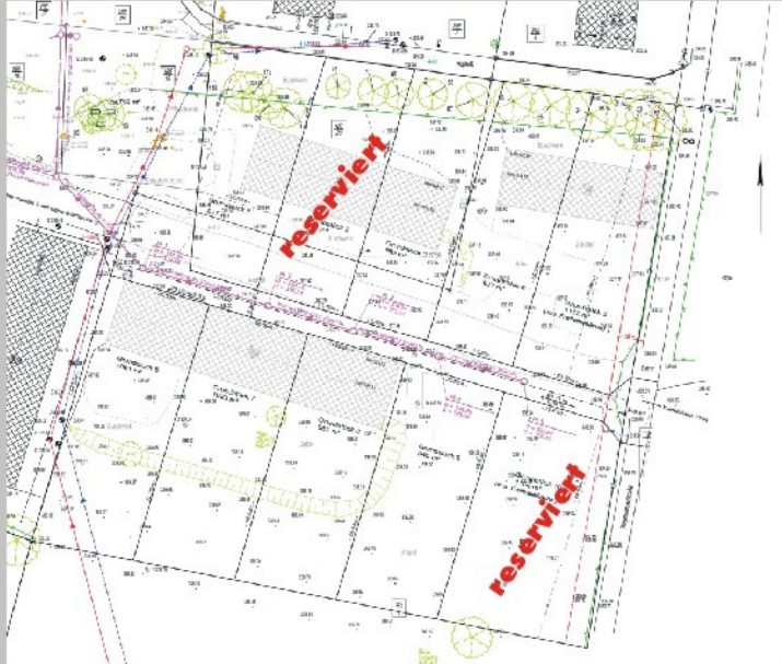
Kaum da und schon nachgefragt: Die Parzellierung der Schafwiesen.