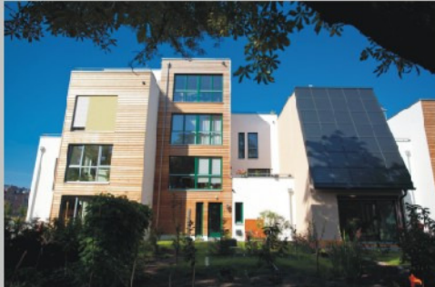
Die Entwicklung: vom 1.Bauabschnitt ....