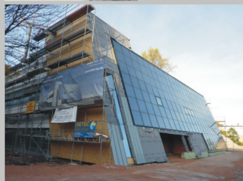
ENERGETIKhaus office in Chemnitz