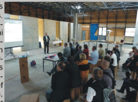
SAENA-Workshop im ENERGETIKhaus office

Neben diesen Besuchen in Chemnitz, stellte sich das ENERGETIKhaus100 o zur Messe in Sinsheim (Baden-Württemberg) und zur Baumesse "Häuserwelten" in Berlin vor. Trotz unterschiedlicher Dialektik fanden spannende Gespräche zum Thema regenerativen Bauens statt und insbesondere der vorgestellte ENERGETIK-Cube verursachte einen positiven Denkanstoß mit weiterführendem Interesse. Die in diesem Jahr im Bau befindlichen ENERGETIKhäuser sind z.T. bereits weit vorangeschritten, so dass Tage der offenen Tür in Baden-Württemberg und Bayern erfolgreich durchgeführt werden konnten. Haben auch Sie Interesse an einer Besichtigung, dann sprechen Sie uns an und wir informieren Sie über die nächsten Termine (siehe Schlagzeilen).