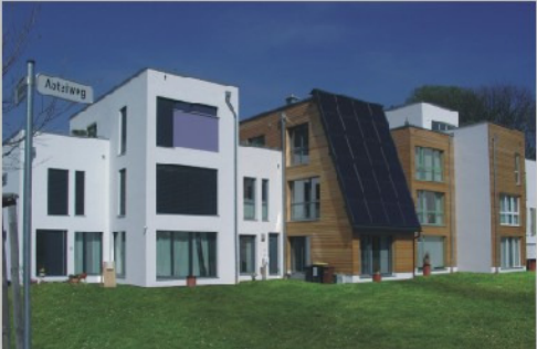
... über den 2.Bauabschnitt bis hin zur ...