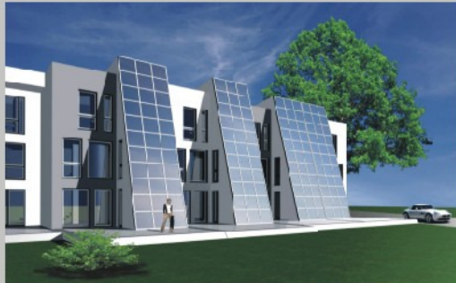
... neuen Generation der "Stadhäuser am Schloss"